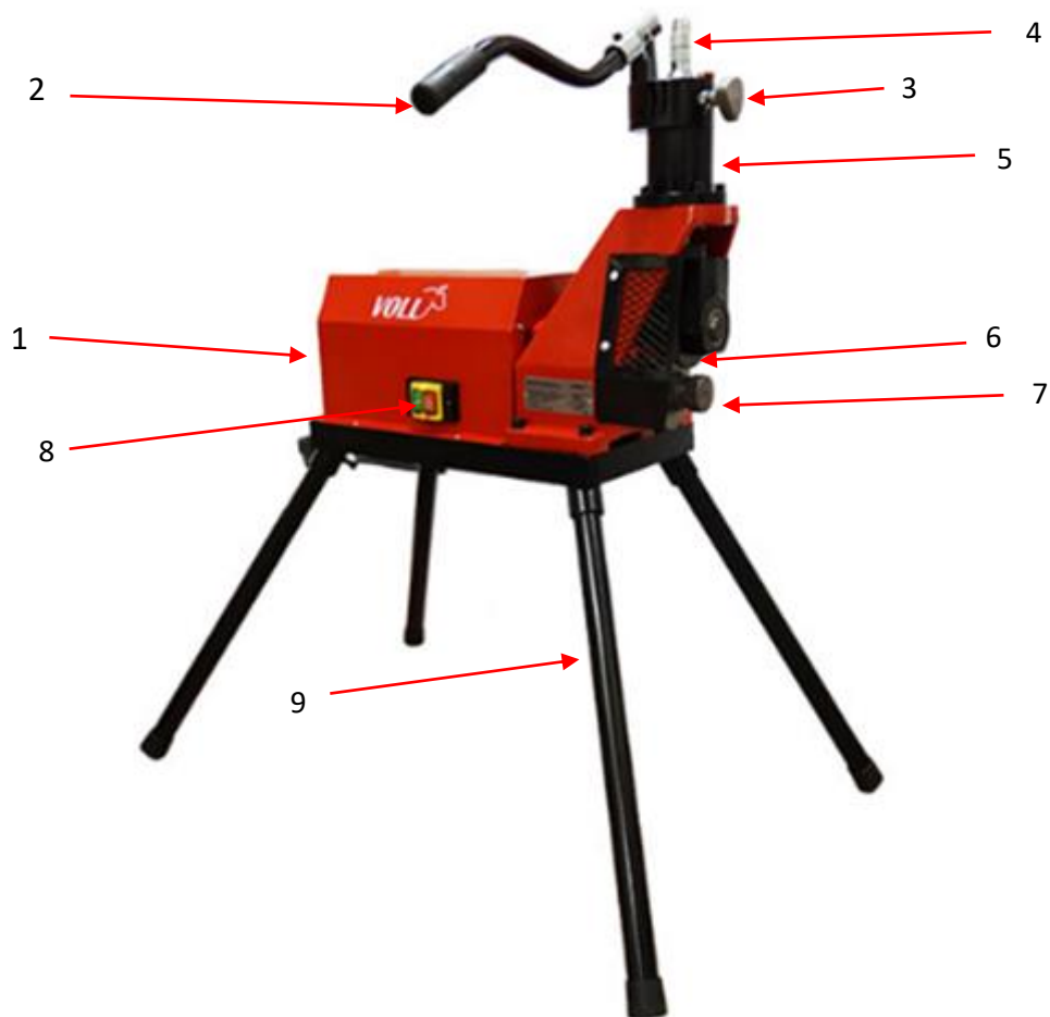
Рис. 1 Устройство желобонакатного станка

1-Станина со съемными ножками; 2-Ручка гидравлического пресса; 3-Винт перепускного клапана; 4-Винт для регулировки глубины накатки желоба; 5-Гидравлический ручной пресс для подачи накаточного ролика; 6-Накатывающий ролик; 7-Ведущий ролик; 8-Кнопка включения/выключения; 9-Опорные ножки.