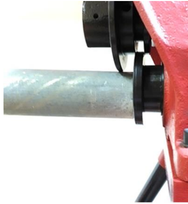
Рис. 2 Установка трубы