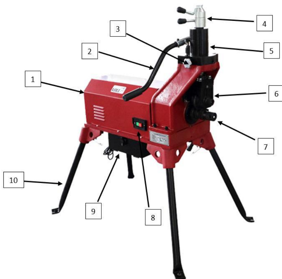
Рис. 1 Устройство желобонакатного станка

1-Станина со съемными ножками; 2-Ручка гидравлического пресса; 3-Винт перепускного клапана; 4-Винт для регулировки глубины накатки желоба; 5-Гидравлический ручной пресс для подачи накаточного ролика; 6-Накатывающий ролик; 7-Ведущий ролик; 8-Кнопка включения/выключения; 9-Бокс для хранения роликов; 10-Опорные ножки.